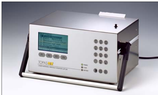
Laser Aerosol Particle Counter LAP 340